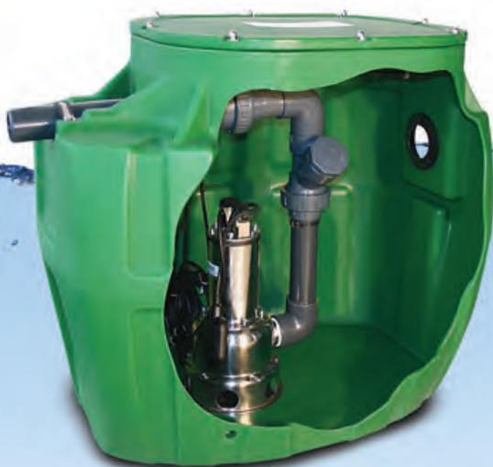
SANIREL 300 VERSION KIT DE CONNEXION