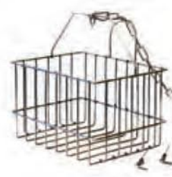
Panier de dégrillage (option)