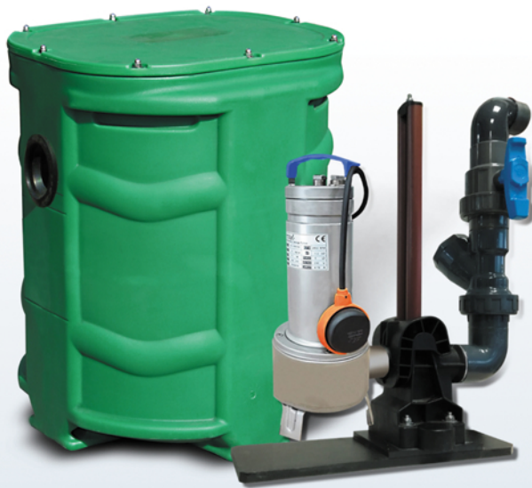
SANIREL 250 1 POMPE BARRES DE GUIDAGE