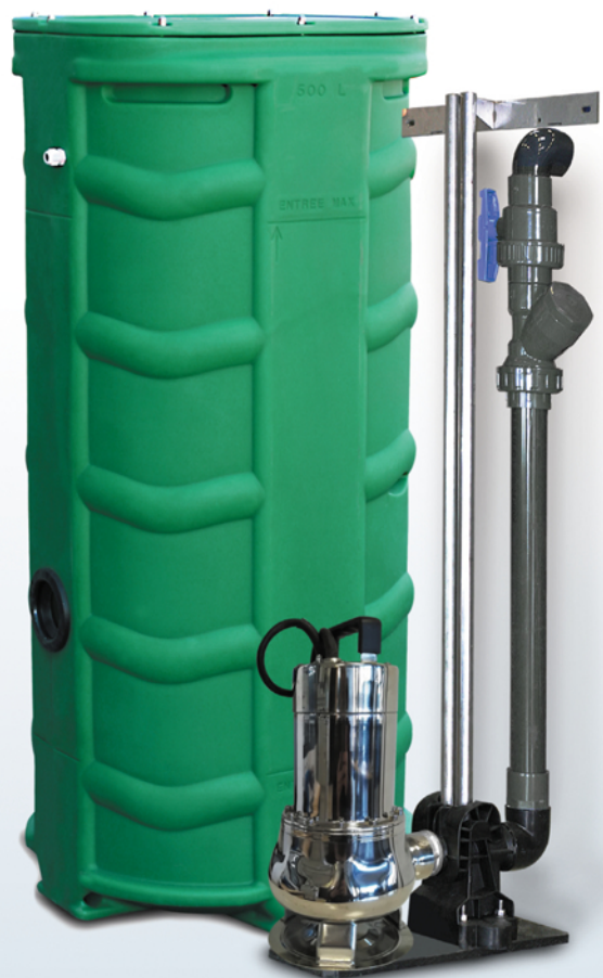
SANIREL 500V 1 POMPE BARRES DE GUIDAGE