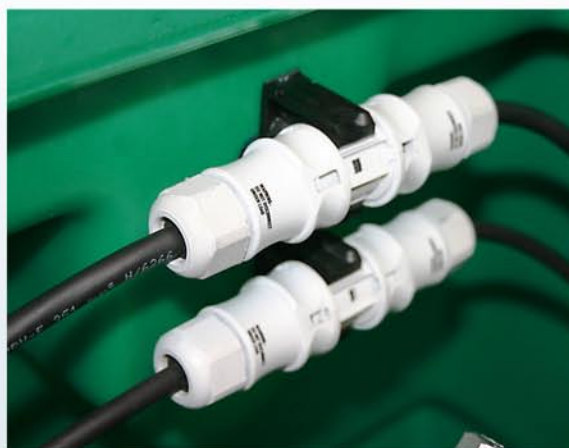
Connecteur étanche IP68 M/F 3 pôles monté dans la station : Réf : 001163