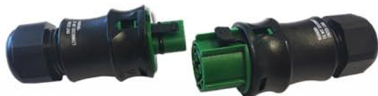
Connecteur étanche IP68 M/F 3 pôles Réf : 000492